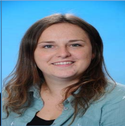
D. Roelofs Economie