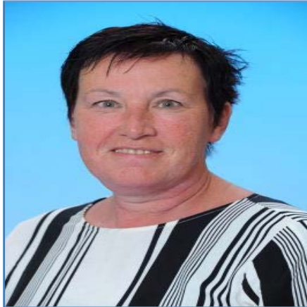
S. Stout Biologie