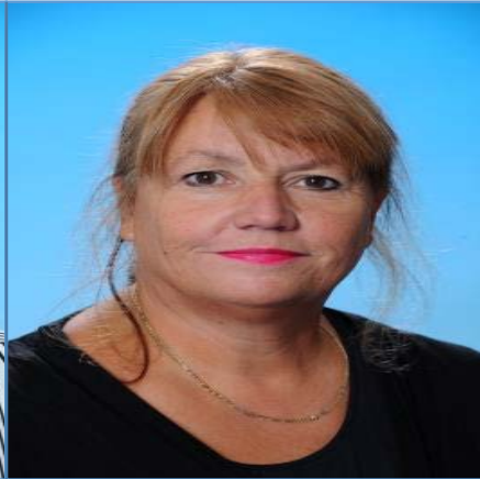
L. Jansen C.K.V. / tekenen